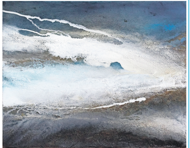
Bild mit dem Titel «Journey» – auch die Werkstatt und das Atelier kann man besuchen.